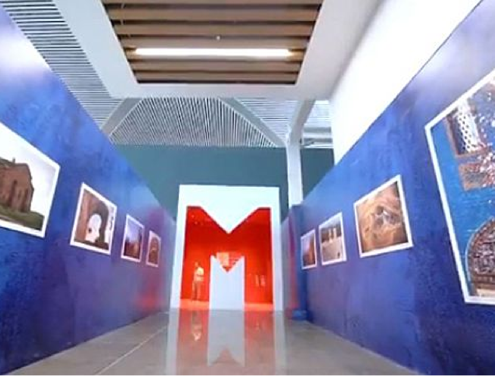
Arkeolog Asena YAŞAR

Dünyanın en modern ve en büyük havalimanlarından biri olan İstanbul Havalimanı, İstanbul'un kuzeybatısında Arnavutköy'de yer almaktadır. 2018 yılında açılışı yapılan Havalimanı, büyük ve modern terminalleri ile milyonlarca yolcuya, yalnız ulaşım değil aynı zamanda kültürel anlamda da 24 saat hizmet vermektedir.